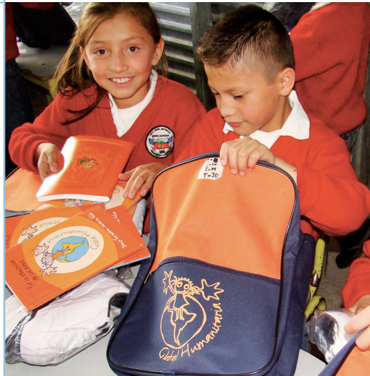
Global Humanitaria (Foto)