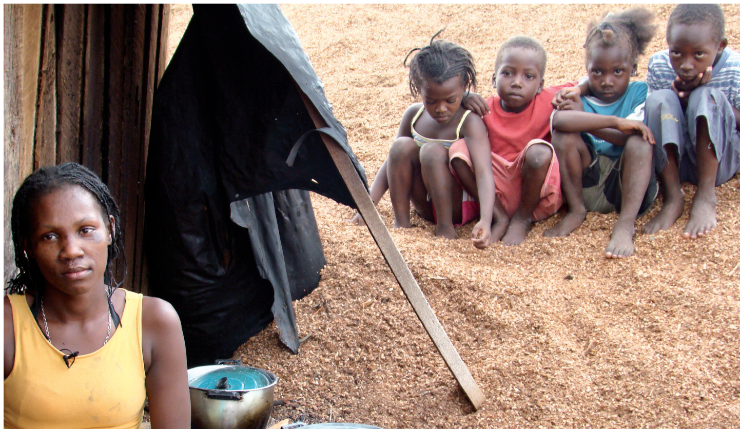
● Familia de Tumaco

Toda intervención en temas de conflicto sugiere siempre impactos positivos que buscan una resolución dirigida al desarrollo y la construcción de la paz. Sin embargo algunas acciones, sin pretender serlo, se convierten en acciones de doble filo que pueden causar efectos negativos dentro de la intervención.