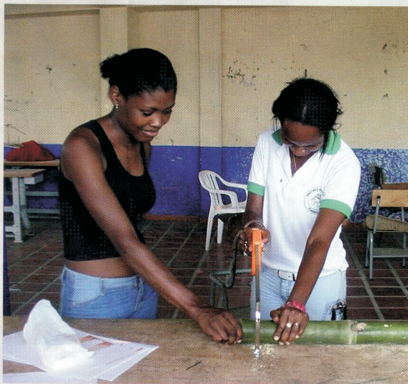
◉ Dos mujeres trabajando la caña

Fernanda Luna Serna [Texto]