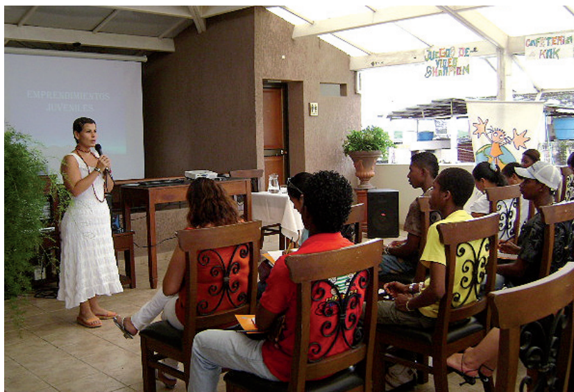
▶ Evento de clausura Proyecto Emprendimientos Juveniles

Con un tiempo de ejecución de once y nueve meses respectivamente, los proyectos Ambiental y Emprendimientos llegaron a su fin. El resultado: la creación de conciencia ambiental y la generación de empleo y proyectos productivos desde la iniciativa de los jóvenes.