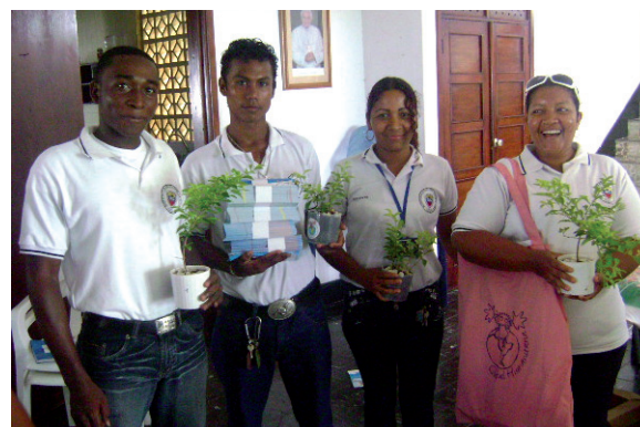
▶ Evento de clausura proyecto Educación Ambiental

Fernanda Luna Serna [Texto]