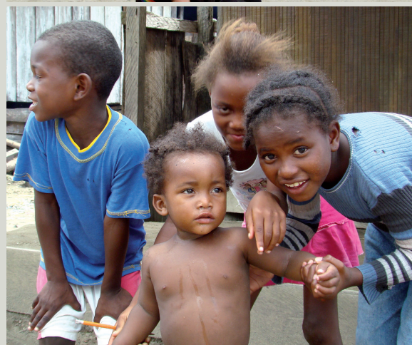
▶ Niña de Salahonda cargando a su hermanita.