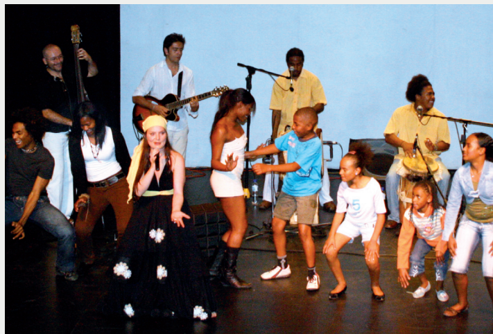
► Presentación de la Agrupación María Mulata junto con niños y jóvenes bailarines del grupo cultural de danzas del pacífico Palenke

El 17 de diciembre de 2008 Global Humanitaria Colombia realizó una gala especial en el Teatro Leonardus de la ciudad de Bogotá, para conmemorar los diez años de permanencia de la organización de origen español en Colombia.