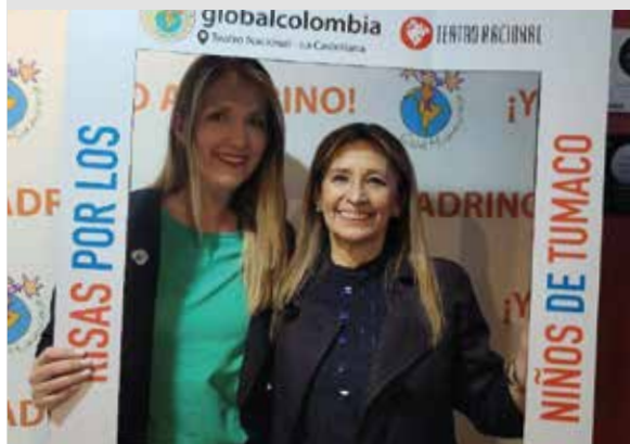
Función Solidaria- Arte que cambia vidas - Pag 22