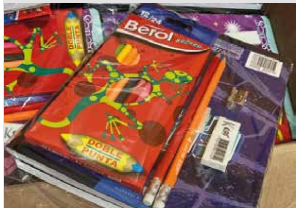
Empresas Solidarias: Construyendo un futuro - Pag 19