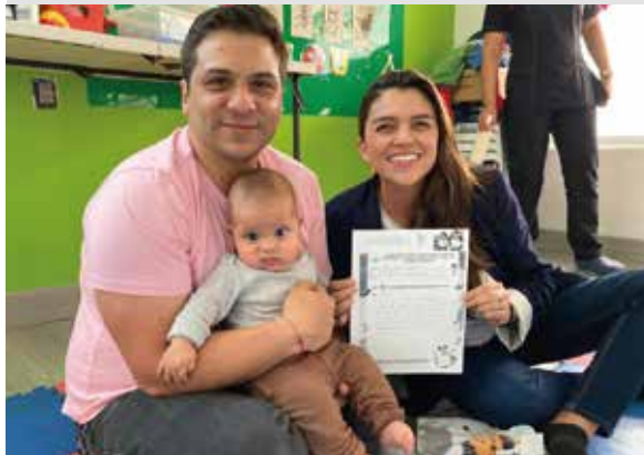
Gymboree- Con amor para cada niño y niña de Tumaco - Pag 10