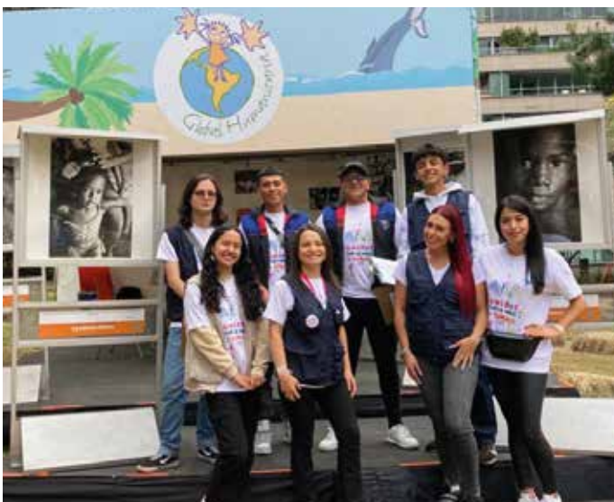
Exposición Pacífico Olvidado: Tributo al Pacífico Nariñense.

Global Humanitaria Colombia expresa sus sentimientos de agradecimiento al compromiso social de THE GULA GROUP, que se sumó a la causa educativa de la niñez de Tumaco brindando un espacio de sensibilización en el Festival Bogotá Eats a Cielo Abierto Vol 3. Este evento contó con la Exposición Fotográfica "Pacífico Olvidado" como un conmovedor tributo visual al Pacífico Nariñense y a su comunidad resiliente.