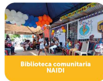
Biblioteca comunitaria NAIDI