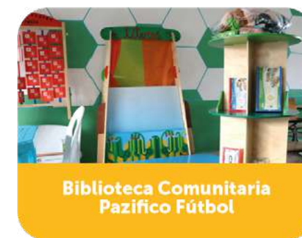
Biblioteca Comunitaria Pazífico Fútbol