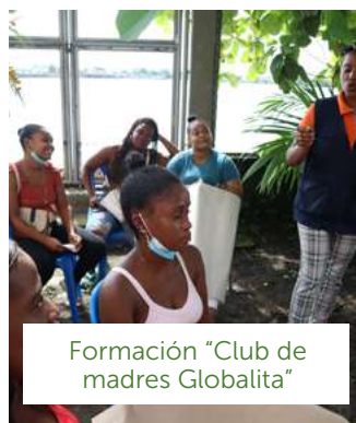
Formación "Club de madres Globalita"