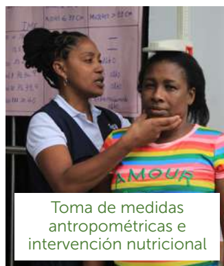
Toma de medidas antropométricas e intervención nutricional