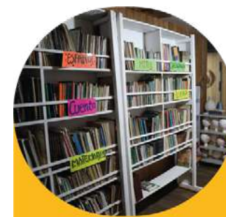
Biblioteca Comunitaria Ecos del Pacífico