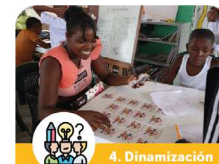
4. Dinamización bibliotecas comunitarias