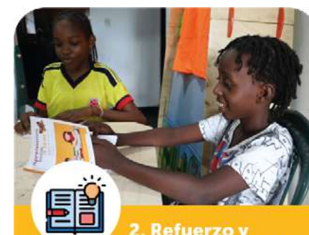
2. Refuerzo y remediación escolar