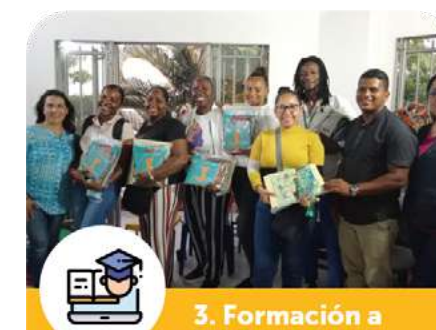
3. Formación a Bibliotecarios Comunitarios