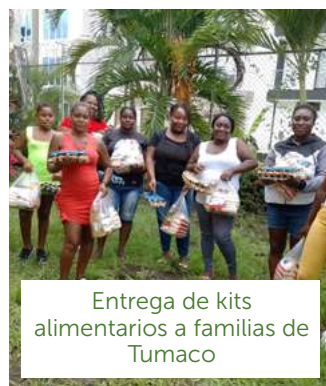
Entrega de kits alimentarios a familias de Tumaco