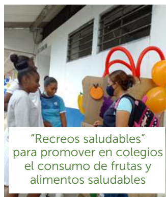
"Recreos saludables" para promover en colegios el consumo de frutas y alimentos saludables