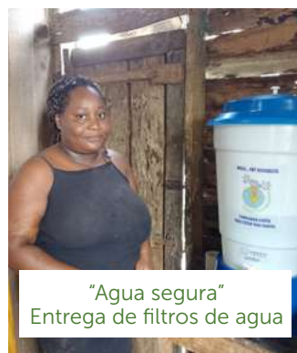
"Agua segura" Entrega de filtros de agua