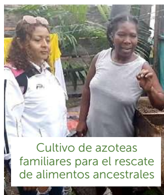
Cultivo de azoteas familiares para el rescate de alimentos ancestrales