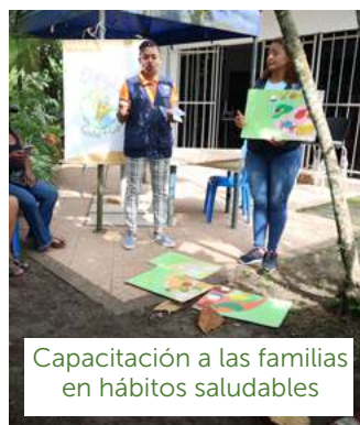
Capacitación a las familias en hábitos saludables

En el 2022 buscamos contribuir en la mitigación de los riesgos de malnutrición de las familias, ocasionada por la emergencia sanitaria del COVID 19 en Tumaco y Francisco Pizarro.