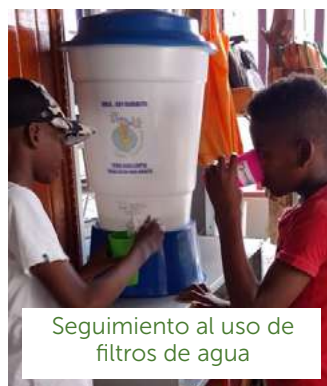
Seguimiento al uso de filtros de agua