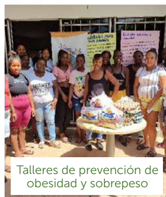
Talleres de prevención de obesidad y sobrepeso