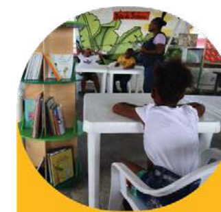
Biblioteca Comunitaria Calipso