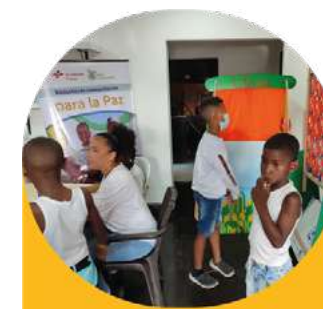
Biblioteca Expresión Arte y vida