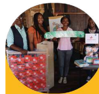
Biblioteca Comunitaria Tumac