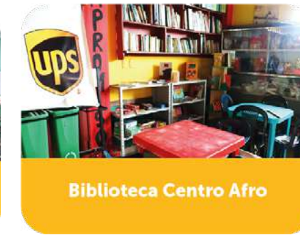
Biblioteca Centro Afro