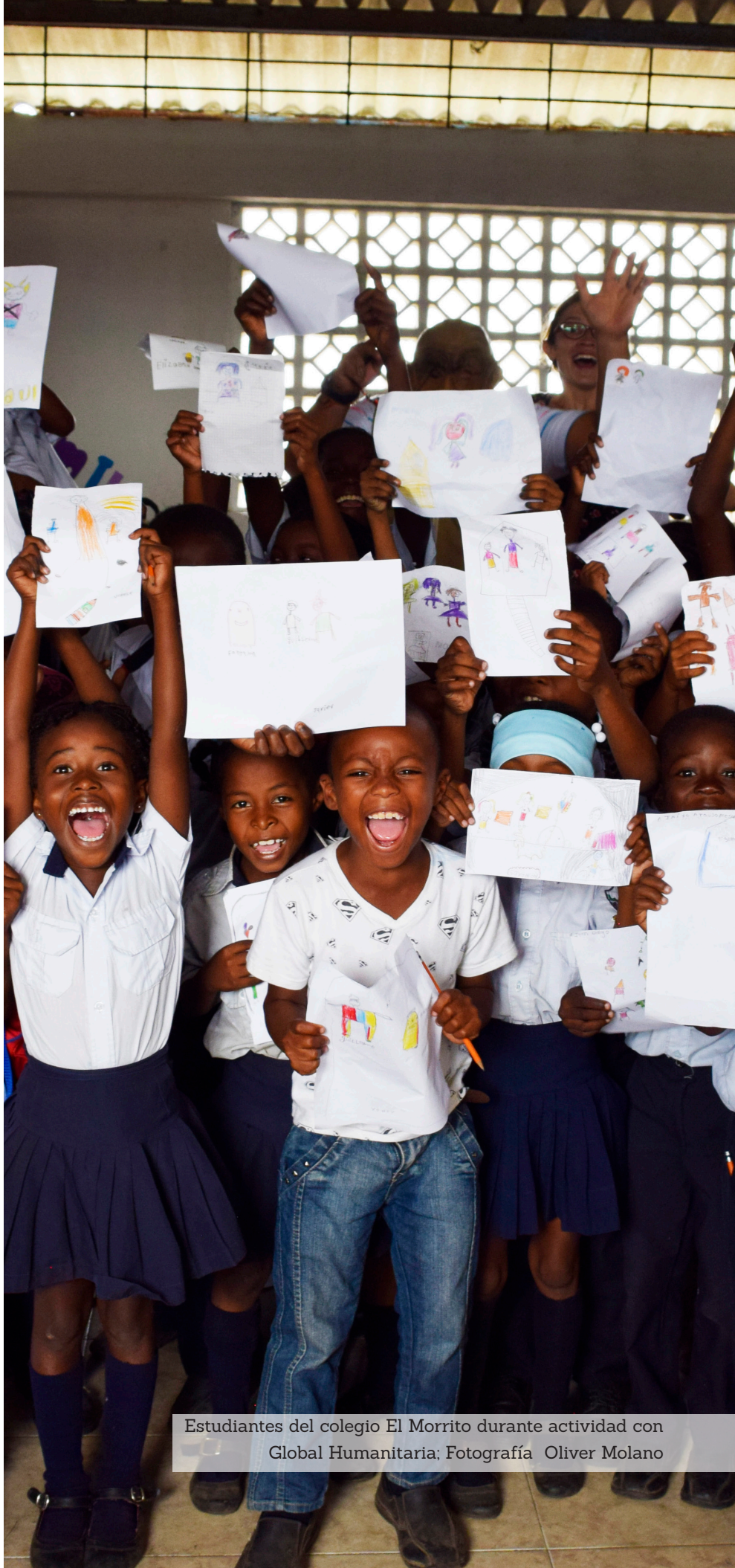
Estudiantes del colegio El Morrito durante actividad con Global Humanitaria

Global Humanitaria no se responsabiliza de los contenidos firmados por los colaboradores externos de la revista.