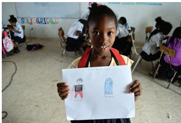
Estudiante del Colegio El Morrito en actividad con Global Humanitaria

“El sueño es que al terminar este proceso, la biblioteca sea el eje central del proyecto educativo institucional de cada colegio; todo lo que se ha dicho aquí tiene que ver con paz, pues si transformamos estos espacios es preferible un niño agarrando un libro, un padre agarrando un libro, un docente agarrando un libro en vez de estar agarrando una piedra y más adelante un fusil, eso es lo que esperamos con este proceso que se llama educando para la paz.” Por eso iniciativas como esta cobran especial importancia porque a través de ellas se rescata el derecho de las comunidades de aprender de su cultura creando así pertenencia étnica y a una cultura de paz a través de nuevas oportunidades”.