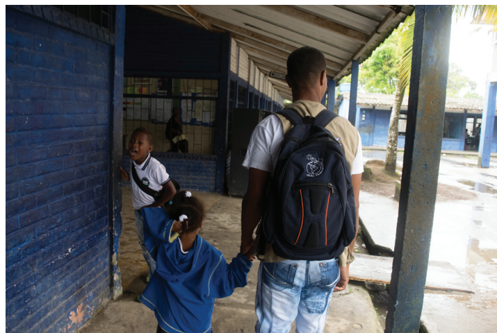
Estudiante del municipio de Salahonda con técnico de Global Humanitaria

Las dos sedes del Colegio Señor del Mar y La Institución Educativa Agroecológica La Playa, hacen parte de las 17 sedes que se están acompañando con el proyecto Educando para la Paz.