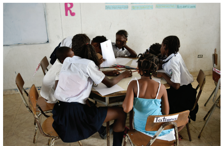
Estudiantes del Colegio El Morrito en actividad con Global Humanitaria