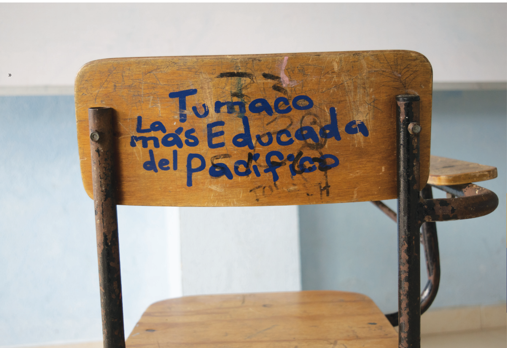
Pupitre en colegio de Tumaco, Nariño