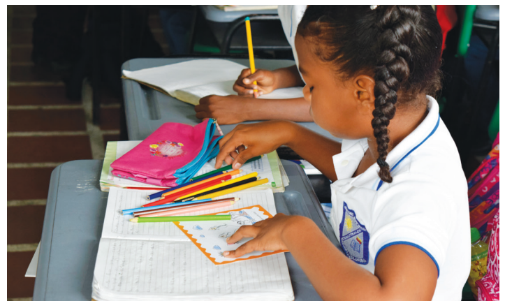
Estudiante del Colegio Ciudadela en actividad con Global Humanitaria

“En las bibliotecas hemos encontrado un poco de todo, de abandono, de falta de conciencia de lo que significa una biblioteca, de los significados de lo que debería y no debería estar; las bibliotecas se vuelven depósitos, lugares oscuros y a veces están bajo llave”.