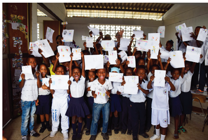
Estudiantes del Colegio El Morrito en actividad con Global Humanitaria