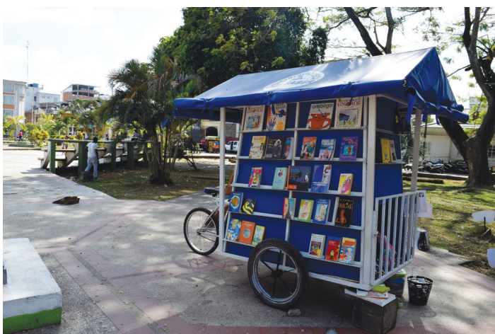
Bicibiblioteca del Saber ubicada en el parque Colón en Tumaco, Nariño

El reto de esta iniciativa estaba en hacer refuerzo escolar de una manera diferente e innovadora, dejando el modelo tradicional de la “educación bancaria” para los niños y niñas y para ello se estableció una alianza con la Fundación