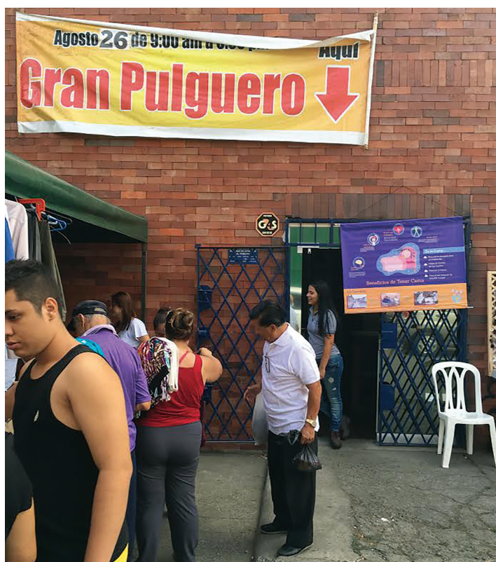
Imágenes del Pulguero realizado en la ciudad de Cali.