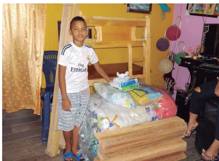
Entrega de donativo a familia en Tumaco.