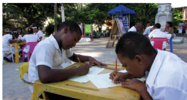
Estudiantes aprendiendo a escribir.