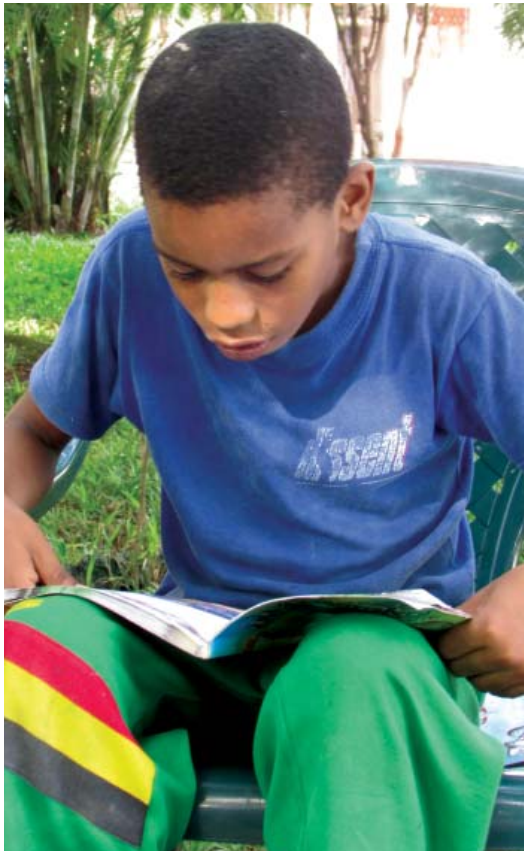
Diariamente, niños y niñas visitan la Bicibiblioteca.