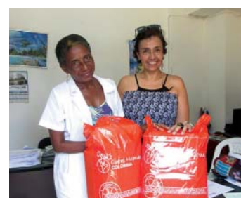
Trabajadores de Coopanamericana entregando su donación en el municipio de Tumaco.

5 ¿Por qué crees que es importante el tema de Responsabilidad Social Empresarial (RSE) en las entidades?