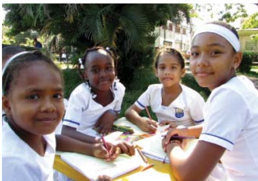
Los niños y niñas en su actividad de dibujo.