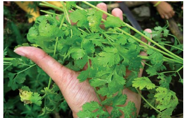
Producto cultivado en la huerta de la Institución Educativa San Luis Robles

R/ A lo largo de los años, los estudiantes se han interesado cada vez más en asistir a la huerta y realizar las actividades que se desarrollan allá. Es algo que se ha hecho evidente y representa un gran logro para la Institución y para Global Humanitaria.