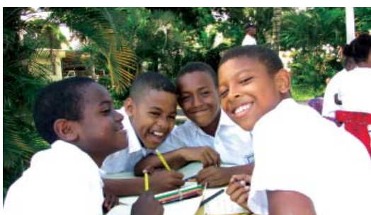
Alumnos de la I.E. Fátima en la Bicibiblioteca.