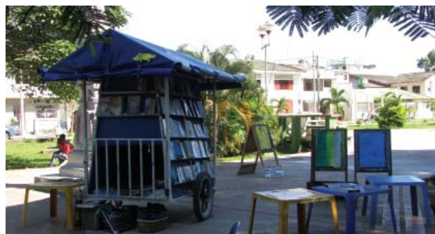
Bicibiblioteca del Saber- Parque Colón.