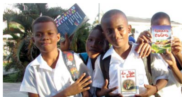
Diariamente, los alumnos reciben libros de la Bicibiblioteca.