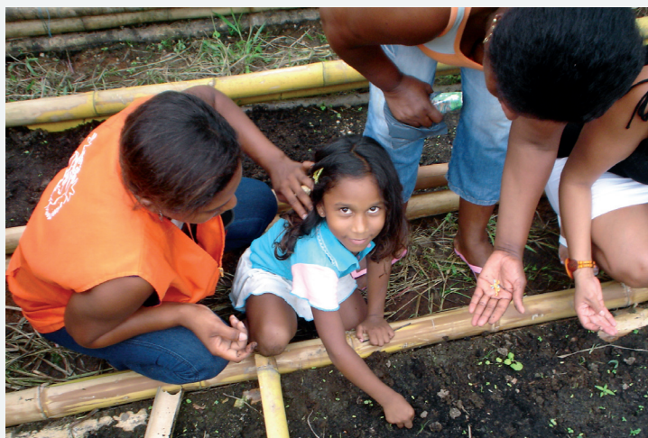
Niños y madres participan constantemente la siembra y el mantenimiento de la huerta.

la actividad, considera que la huerta no solo soluciona en gran medida la carencia de una dieta segura y balanceada, sino que además promueve en las madres y los niños un cambio en los hábitos alimenticios. “Uno de los grandes problemas alimentarios en la región es el bajo consumo de frutas y verduras ocasionado principalmente por hábitos alimentarios basados en el consumo excesivo de carbohidratos, además del difícil acceso a los alimentos, ya sea por escasez o por inaccesibilidad económica. Con la creación de la huerta escolar, pretendemos generar un cambio en los hábitos alimentarios de las fa-