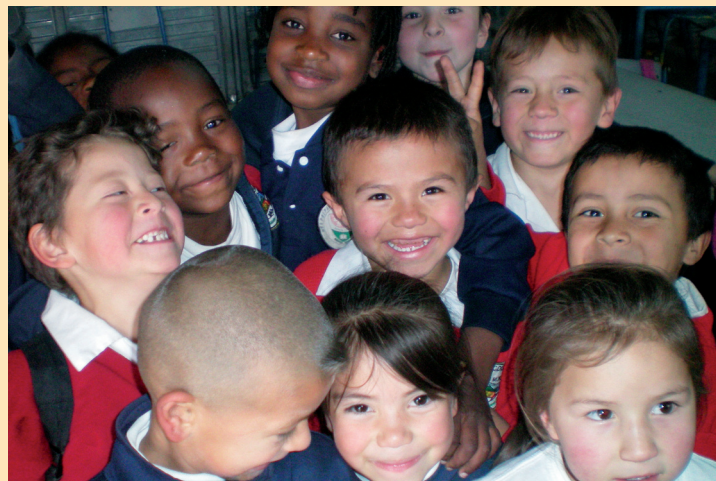
▶ El nivel de escolaridad en Altos de Cazuca llega solo a 4,7 años de educación recibida.