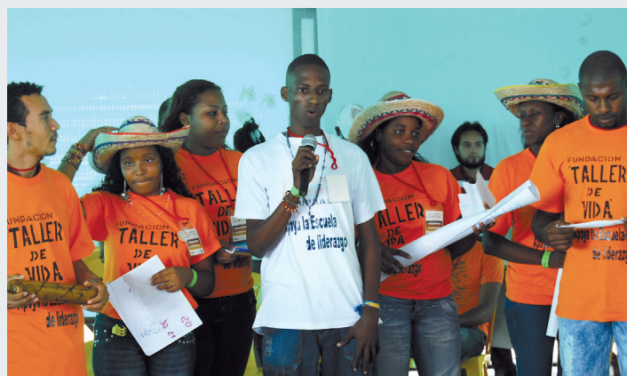
Jóvenes del proyecto en Tumaco.

La Escuela muestra alternativas de paz y de desarrollo pero a la vez, muestra como los jóvenes pueden ser los que protagonicen esas alternativas, inventen su historia y se vuelvan líderes de sus comunidades y de sus vidas.