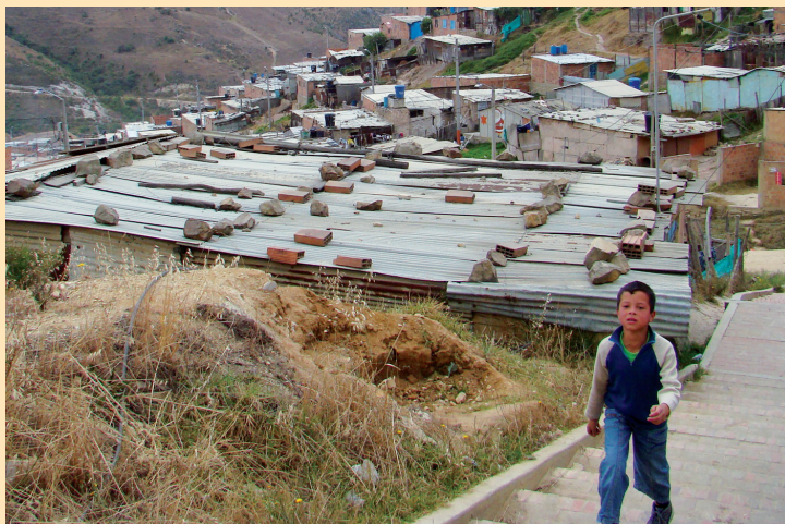
▶ La pobreza en Altos de Cazuca es la principal causa de deserción escolar.

Fernanda Luna [Texto]