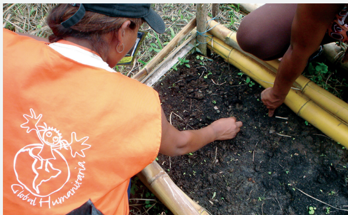
Personal de Global Humanitaria y la UMATA han realizado acompañamiento profesional y técnico a la huerta

En la región pacífica el acceso a una alimentación balanceada y de calidad para los niños y niñas se ve afectado constantemente por diversos factores como el narcotráfico, el conflicto armado, el desplazamiento y los altos niveles de pobreza, que de una u otra forma han alterado las cadenas productivas de los alimentos, disminuyendo además la producción de aquellos propios de la región, como consecuencia gran cantidad de los niños en edad pre-escolar del municipio presentan desnutrición crónica. La huerta construida en mayo de este año ha contribuido en gran medida a contrarrestar esta problemática, puesto que los escolares obtienen alimentos de calidad cultivados por ellos mismos, y las madres que también participan en la huerta, han retomado la tradición cultural de la siembra en las casas, aportando a la economía familiar, y accediendo a todo tipo de alimentos entre frutas y verduras, para equilibrar la alimentación diaria de su familia.